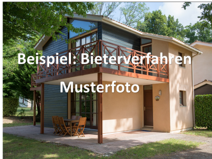
Beispiel: Bieterverfahren Musterfoto

Gerne sind wir Ihnen auch bei der Finanzierung behilflich. Unsere Finanzierungsexperten beantworten in einem persönlichen Gespräch gerne alle Fragen rund um die Finanzierung und erstellen Ihnen einen kostenlosen und unverbindlichen Finanzierungsvorschlag unter Einbindung möglicher Fördergelder.